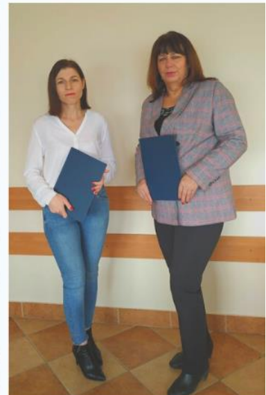
Podpisanie umowy o współpracy w firmą UNIBEP S.A.